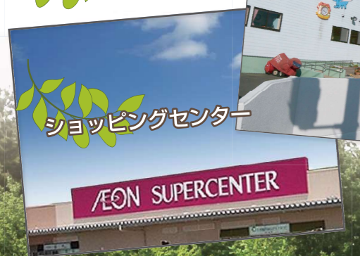
ショッピングセンター